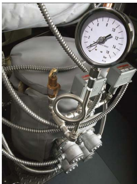
Встроенный парогенератор из нерж. стали, маркировка CE, соответствие PED