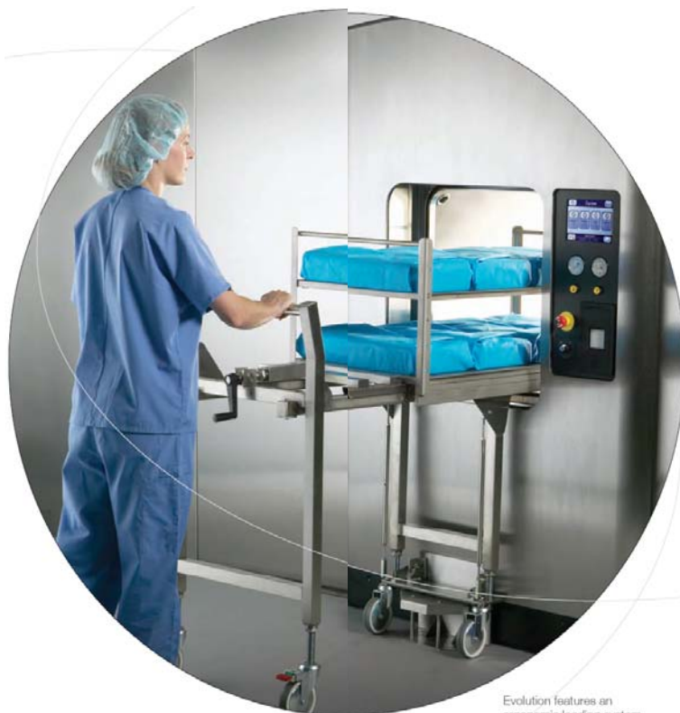
Evolution features an ergonomic loading system

Оптимизированная форма стерилизационной камеры Amsco Evolution обеспечивает равномерное распределение температуры и давления. Камера полностью заключена в рубашку, что минимизирует конденсацию и позволяет с точностью поддерживать заданные условия каждого цикла при минимальном потреблении пара. Ширина камеры 660 мм очень удобна для загрузки. Новая конструкция стерилизационной камеры позволяет улучшить функциональность стерилизатора и снизить эксплуатационные расходы.