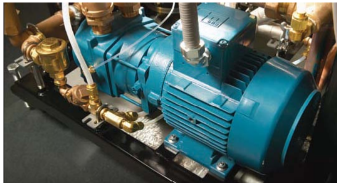
Двухступенчатый вакуумный насос, бесшумный, позволяет снизить потребление воды