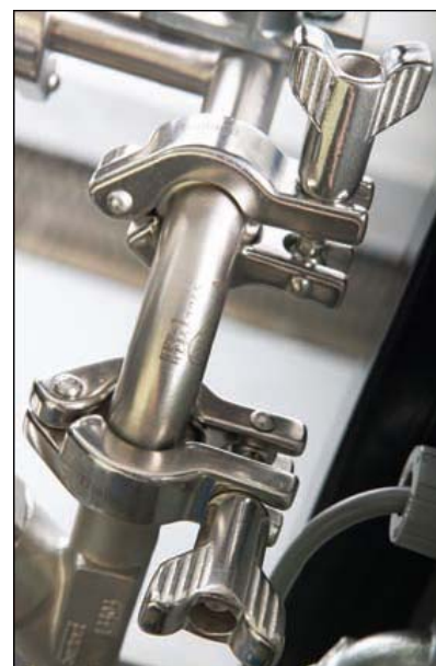
Фитинги Triclamp обеспечивают чистое соединение и модульность для удобства обслуживания