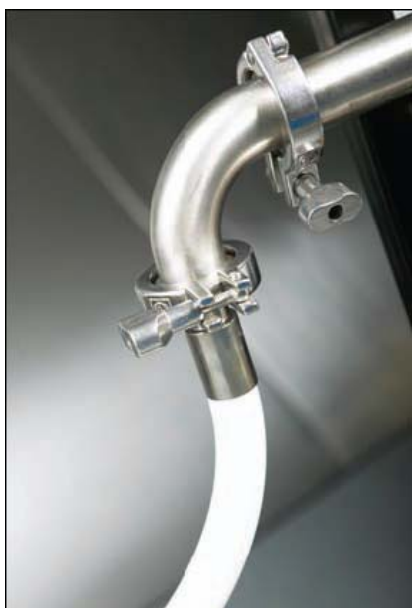
Быстрые гибкие подключения ресурсов и слива