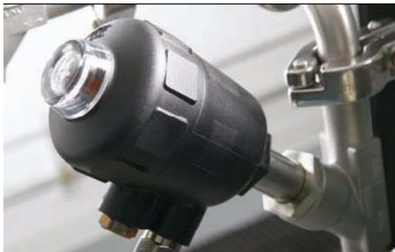
Клапаны Burkert с длительным сроком эксплуатации